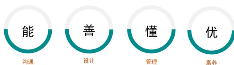
图 1: “能善懂优”培养目标

计算机辅助设计等知识,具备建筑装饰制图与识图、建筑装饰设计、建筑装饰施工图深化设计等能力,具有工匠精神和信息素养。结合行业、企业的岗位标准、职业能力结构的要求。注重“设计基础技能和设计习惯养成”,以设计实务、工程品质控管为核心能力,培养在一线从事装饰室内设计管理工作、具有“能沟通、善设计、懂管理、优素养”的一专多能高素质技术技能人才。